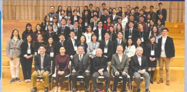
財団奨学生懇親会イベント（2019年開催）